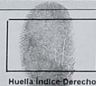
Huella Índice Derecho